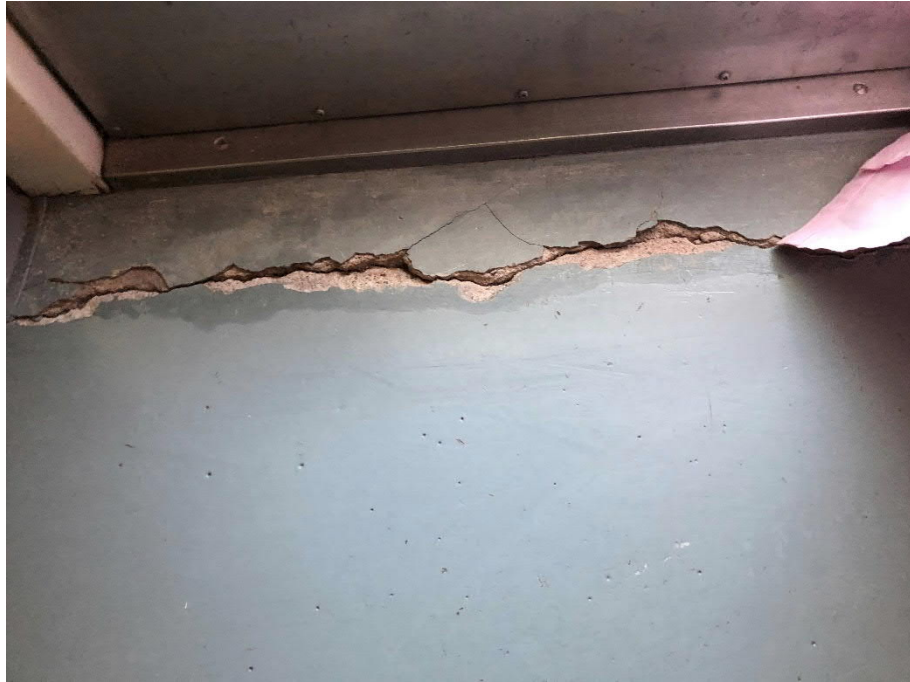
kuva 3: Tuulikaapin ulko-oven kohdalla on painumasta johtuva halkeama.