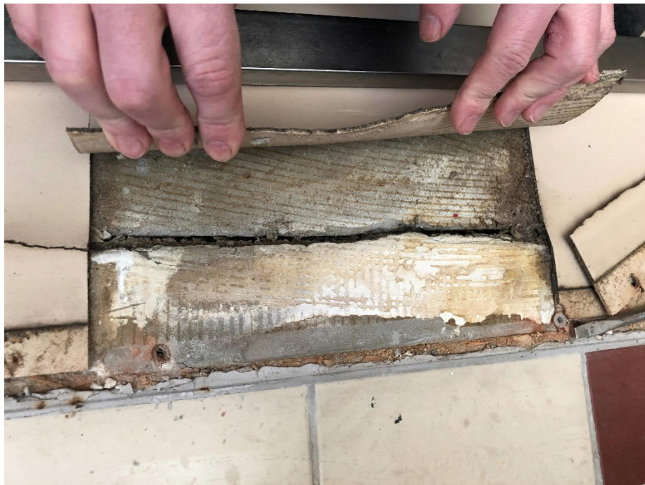
Kuva 2: Laulu- ja leikkisalin oviaukon kohdalla on painumasta johtuva halkeama, joka saattaa jatkua väliseinän alle.