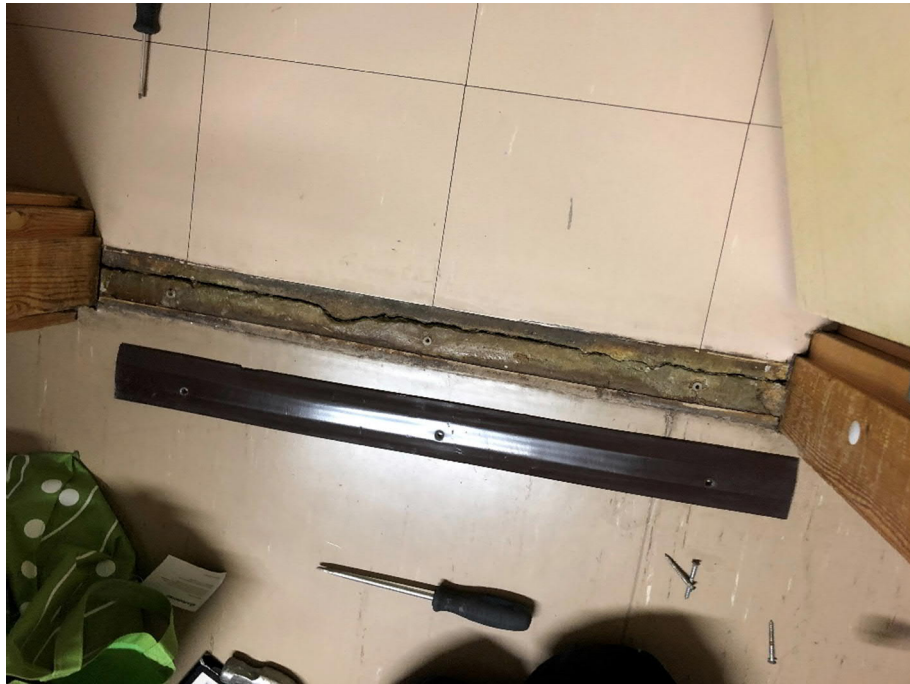
Kuva 5: Liikuntasäama on epätiivis ja jatkuu väliseinien alle.