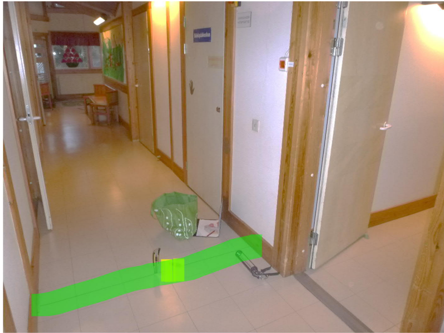
Kuva 1: Liikuntasauva on epätiivis ja saattaa jatkua väliseinärakenteiden alla.