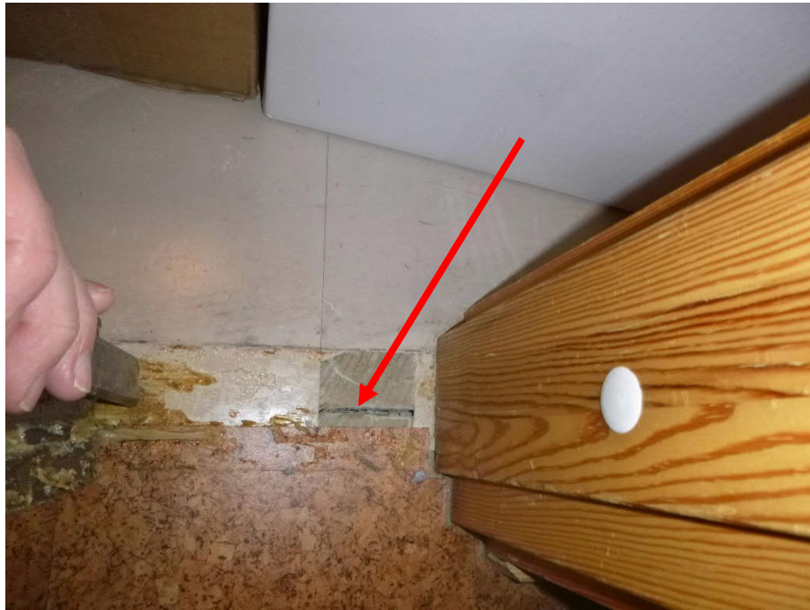
Kuva 7: Liikuntasauma lattiapinnoitteen alla on epätiivis ja jatkuu väliseinien alle.