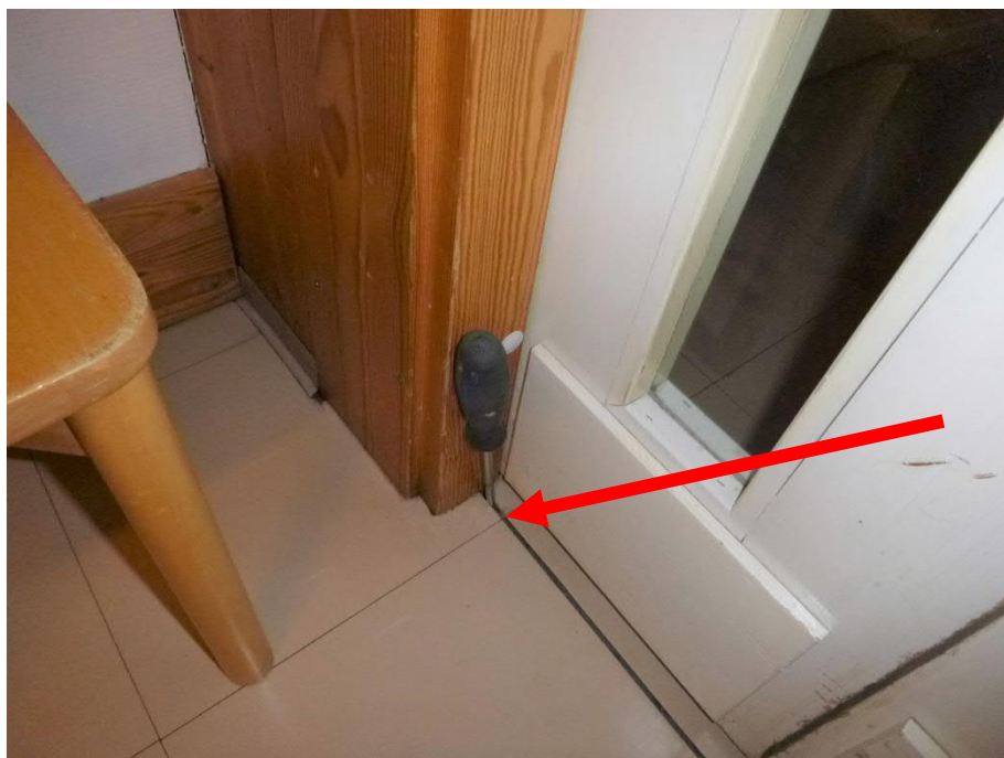
Kuva 6: Liikuntasäama on epätiivis ja jatkuu väliseinien alle.